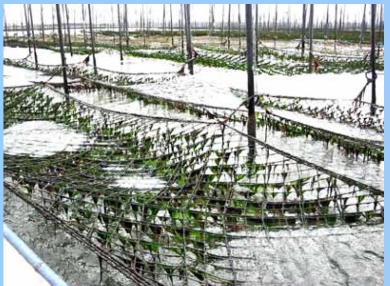
ノリ養殖に用いるノリ支柱柵

「東京湾をよくする会」は、 東京湾の環境をよくするための 「人のつながり」、 「取り組みのつながり」、 「楽しみのつながり」を 広く深くしていきます。