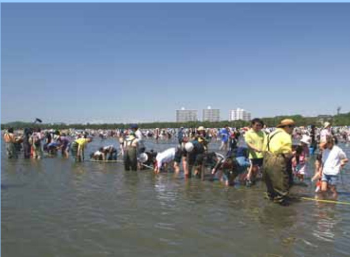
資料) 金沢八景 - 東京湾アマモ場再生会議

東京湾の環境を もっと豊かで美しくするために、 自ら行動し、 その恵みを楽しみましょう